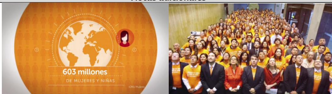
Primer Taller "Género, migración y empoderamiento", Omaha, Nebraska, 13 de junio.