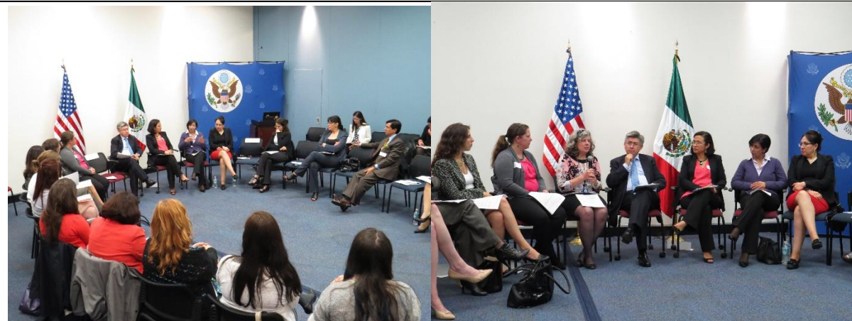
Segunda reunión de trabajo de la Red de Enlaces de Género, 25 de junio.